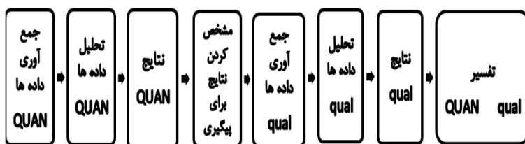
شکل ۱: طرح آمیخته تبیینی: از نوع پیگیری

جامعه و نمونه پژوهش: جامعه آماری شامل معلمان مدارس ابتدایی دولتی هوشمند شهر کرج است. تعداد مدارس ۳۰۰ مورد بوده (ناحیه ۱: ۵۴ مدرسه، ناحیه ۲: ۸۳ مدرسه، ناحیه ۳: ۱۰۰ مدرسه، ناحیه ۴: ۶۳ مدرسه) که از میان آن‌ها و به دلیل خوشه‌ای بودن نمونه‌گیری، ۳۰ مدرسه ابتدایی با رعایت وزن طبقه از نواحی چهارگانه کرج (ناحیه ۱: ۵ مدرسه، ناحیه ۲: ۸ مدرسه، ناحیه ۳: ۱۱ مدرسه، ناحیه ۴: ۶ مدرسه) انتخاب شده است. تعداد خوشه‌ها با استفاده از فرمول میانگین به ازای خوشه برآورد شده است که نمونه انتخاب شده به ازای جامعه، حجم مناسب و قابل قبولی می‌باشد. شایان ذکر است، از مجموع ۳۰ خوشه انتخاب شده، ۱۵۰ معلم به دست آمده است. برای فاز کیفی، از نمونه‌گیری هدفمند بهره گرفته شده و با توجه به معیارهای این نوع نمونه‌گیری، دو گروه ۶ نفره از معلمان به طور آگاهانه و هدفمند انتخاب شده‌اند. تعداد افراد هر گروه بر اساس معیار حداقل افراد مورد نیاز برای تشکیل یک گروه کانونی که شش نفر است، صورت گرفته است (بازرگان، ۱۳۹۱: ۷۸).