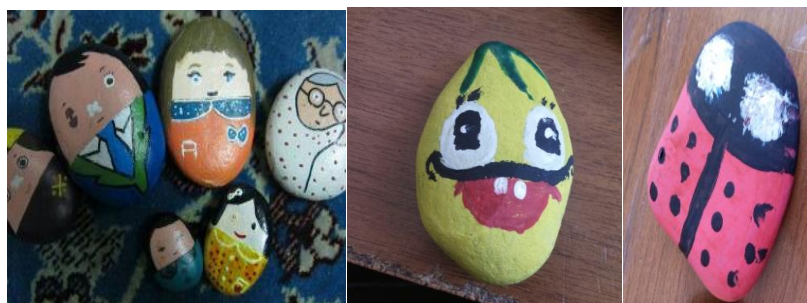
شکل ۴- تلفیق هنر نقاشی با هنرهای بصری تجسمی و تبدیل به شخصیت‌های داستانی