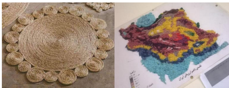
شکل ۸- تلفیق هنر نقاشی با هنر تجسمی: برجسته کاری (به کمک کف و کاموا)