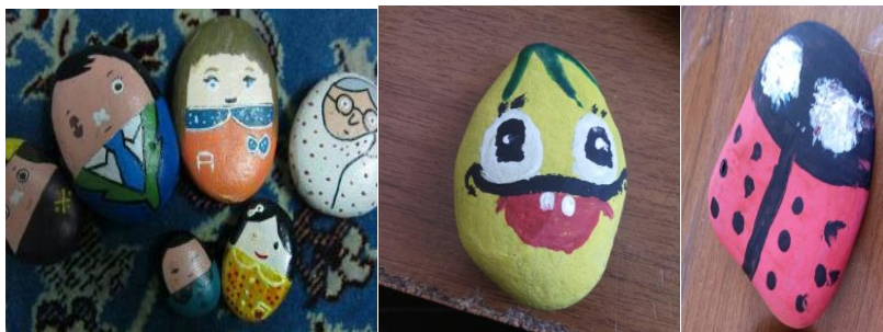
شکل ۴- تلفیق هنر نقاشی با هنرهای بصری تجسمی و تبدیل به شخصیت‌های داستانی