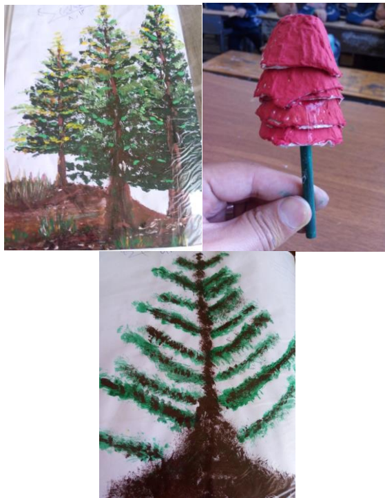
شکل ۵- تلفیق هنر نقاشی پرتابی با هنر گرافیکی یا هنر تجسمی