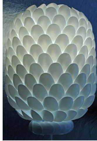
شکل ۱- تلفیق هنر تجسمی و مواد دور ریختنی و ایجاد گل