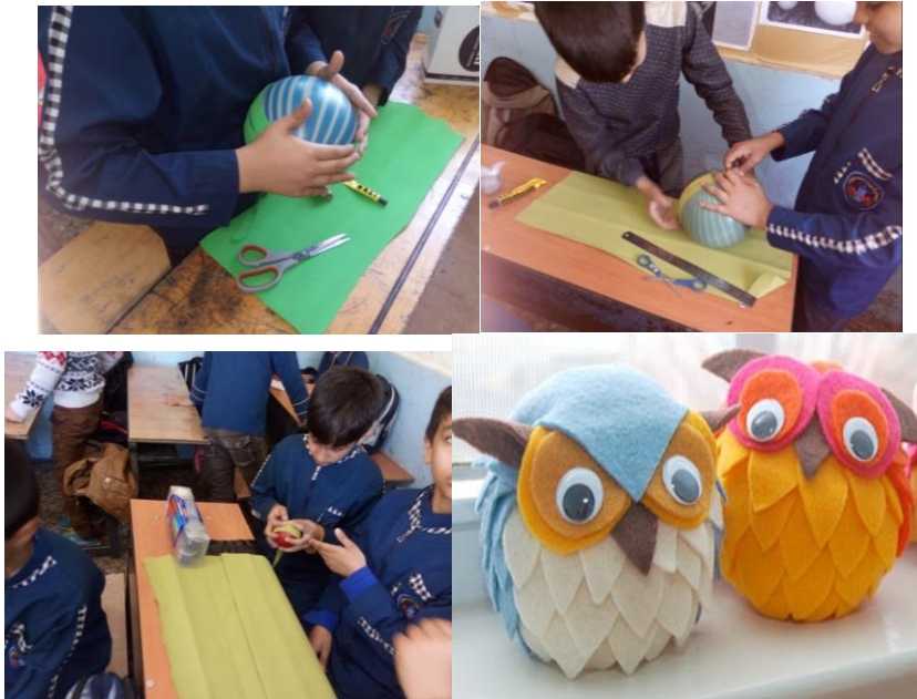
شکل ۳- تلفیق نقاشی با هنر دستی (هنر تجسمی)

شکل ۲- تلفیق داستان سرایی و نمایش همراه با موسیقی خلاقانه دانش آموزان