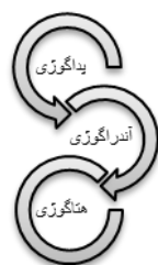
شکل ۱- زنجیره گوژی‌ها

سیر تکوین و شکل‌گیری مفهوم هتاگوژی را باید در ریشه‌های آندراگوژی دانست به‌طوری‌که این رویکرد را می‌توان به‌نوعی بسط و گسترش آندراگوژی قلمداد کرد. زنجیره یادگیری از پداگوژی به آندراگوژی و به هتاگوژی به‌عنوان بخشی از یک فرآیند آموزشی است که در آن مربی/تسهیلگر درحالی‌که توسعه مهارت‌های یادگیری در فراگیرندگان است (شکل زیر):