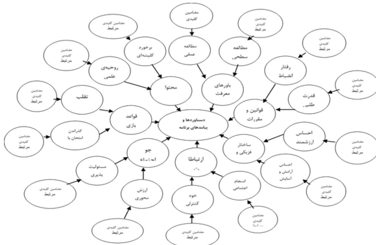
نمودار ۱. شبکه‌ی مضامین دستاوردها و پیامدهای برنامه‌درسی ضمنی دانشگاهی