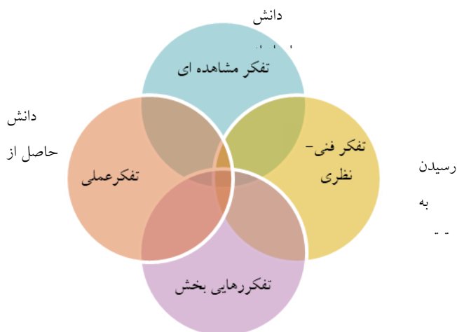
شکل ۱۸ مدل نظری فرا تفسیری روایت‌نگاری تأملی و توسعه حرفه‌ای

کدام معرف دانش مجزایی است: دانشی که از مشاهده رفتار دیگران کسب می‌شود، دانشی که در موقعیت‌های آموزشی رسمی با اهداف از پیش تعیین شده حاصل می‌شود، دانشی که حاصل به اشتراک‌گذاری با دیگران است و دانشی که با انتقال به موقعیت‌های جدید به دست می‌آید. چهار نوع تفکر مجزا و در عین حال، مرتبط با هم که از این معرفت‌های چهارگانه حمایت می‌کنند عبارتند از: تفکر مشاهده‌ای، تفکر فنی-نظری، تفکر عملی و تفکر رهایی‌بخش.