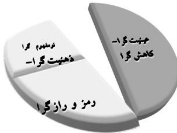
شکل ۱- دو ایده اصلی نظریه‌پردازی که در آن نومفهوم‌گرایی قسمتی از ایده ذهنیت-گرایی - رمز و رازگرایی است.

عصب‌پدیدارشناسی به‌عنوان بستری برای نظریه‌پردازی برنامه‌درسی، فراتر از دو ایده مطرح شده در این مقاله است. ایده‌ عینیت‌گرا - کاهش‌گرا ۲ برای نظریه‌های تبیینی که ساز و کارهای کنترلی و ویژگی آن‌هاست (پرکینسون ۳ ، ۱۹۹۳) و ایده مبتنی بر ذهنیت-گرایی - رمز و رازگرایی ۴ که با دیدگاه‌هایی از قبیل پدیدارشناسی و انسان‌گرایی به جای عینیت‌ها و شواهد آزمایشگاهی، به اول شخص و تجربه انسانی توجه دارد یا با تأکید بر مفاهیم موجود در این حوزه نظریه‌پردازی را تلاشی برای فهم برنامه‌درسی به مثابه یک متن می‌داند (شکل ۱).