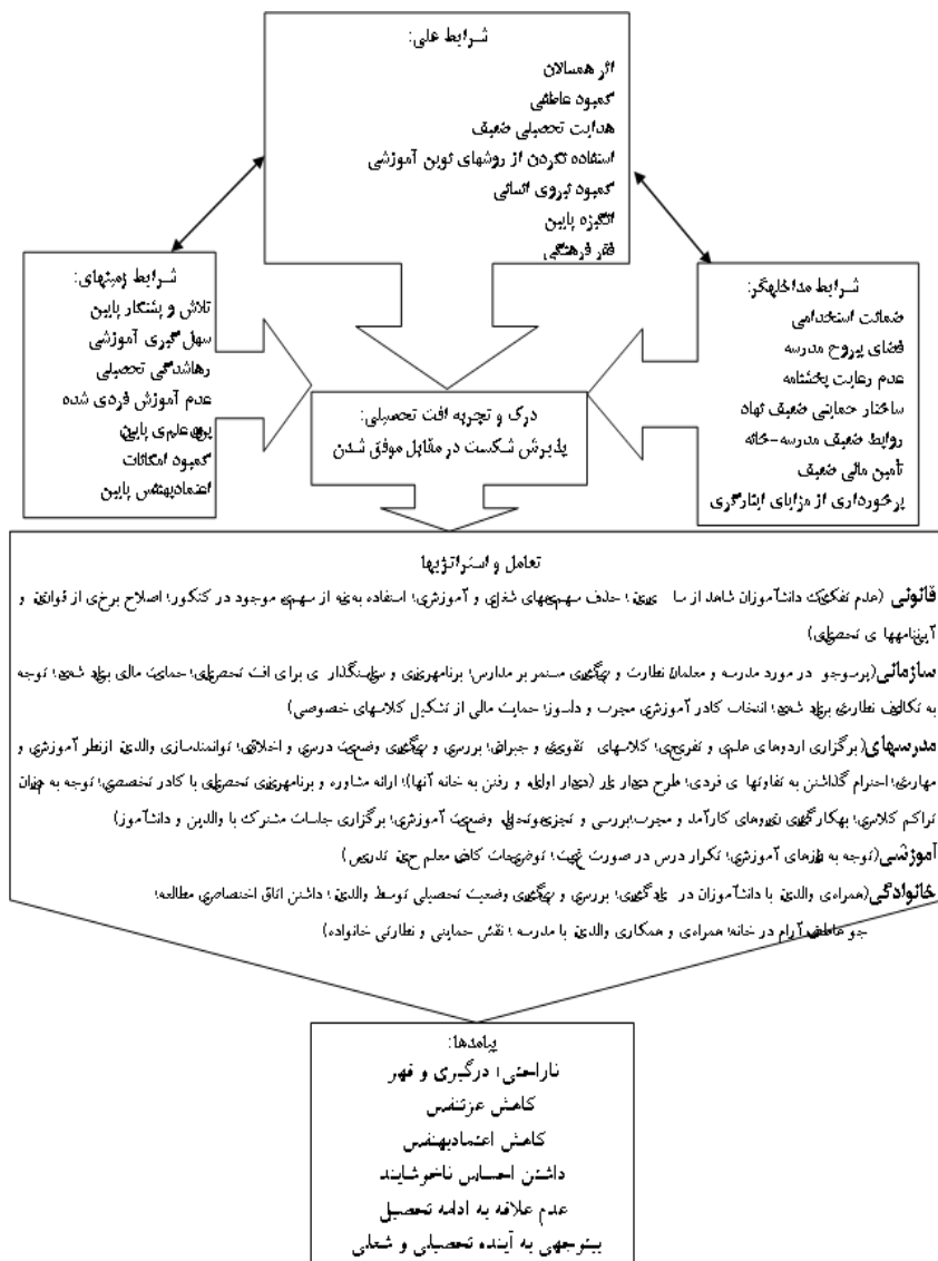
شکل ۲- مدل پارادایمک: افت تحصیلی به‌مثابه پذیرش شکست در مقابل موفق شدن

در مدل پارادایمک پژوهش (شکل ۲)، کنشگران درگیر در افت تحصیلی، این پدیده را به‌مثابه «پذیرش شکست در مقابل موفق شدن» درک و تجربه می‌کنند.