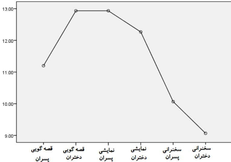
نمودار شماره ۲- بررسی وضعیت حالات تعاملی روش * جنسیت در باب یادگیری میراث ناملموس

جهت تعیین تفاوت بین حالات تعاملی شش گانه از آزمون تعقیبی ال اس دی استفاده شد که نتایج آن در جدول زیر ارائه می شود. لازم به ذکر است حالت روش قصه گویی دختران و نمایش خلاق مشارکتی پسران بیشترین اثر و حالت سخنرانی دختران کمترین اثر بر یادگیری میراث ناملموس دارند.