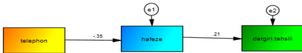
نمودار ۱. ضرایب استاندارد مسیر مدل

برازش خوب الگو با داده‌هاست. شاخص RMSEA برای مدل‌های خوب برابر ۰/۰۵ یا کمتر است. مدل‌هایی که RMSEA آن‌ها ۰/۰۱ باشد، برازش ضعیفی دارند. شاخص GFI که باید برابر یا بزرگ‌تر از ۰/۹۰ باشد، مقدار نسبی واریانس‌ها و کوواریانس‌ها را به گونه مشترک از طریق مدل ارزیابی می‌کند. آزمون مجذور کای (خی دو) این فرضیه را مدل مورد نظر هماهنگ با الگوی هم پراشی بین متغیرهای مشاهده شده است را می‌آزماید، کمیّت خی دو بسیار به حجم نمونه وابسته می‌باشد و نمونه بزرگ کمیّت خی دو را بیش از آنچه که بتوان آن را به غلط بودن مدل نسبت داد، افزایش می‌دهد (هومن، ۱۳۸۷). با توجه به جدول ۱، مقدار RMSEA مدل برابر با ۰/۰۷۸ می‌باشد؛ لذا این مقدار کمتر از ۰/۱ است که نشان‌دهنده این است که میانگین مجذور خطاهای مدل مناسب است و مدل قابل قبول می‌باشد. همچنین مقدار کای دو به درجه آزادی برابر با ۲/۴۶ است که کمتر از ۳ می‌باشد و میزان شاخص CFI، GFI و NFI نیز از ۰/۹ بیشتر می‌باشد که نشان می‌دهند مدل اندازه‌گیری متغیرهای تحقیق، مدل مناسبی است. حال به بررسی سؤالات پژوهش فوق می‌پردازیم.