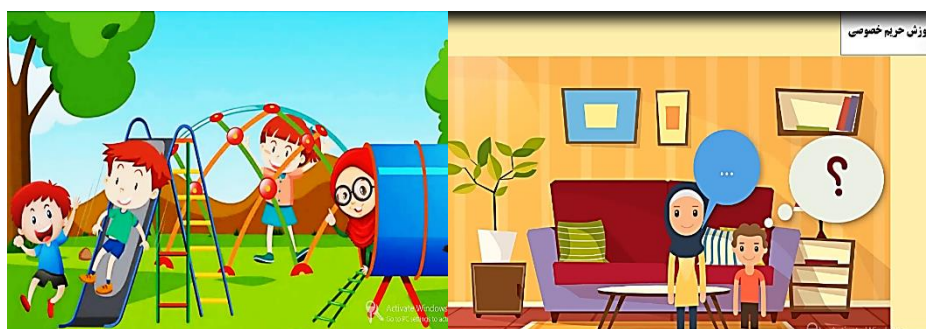
شکل ۲. نمایی از چندرسانه‌ای آموزشی

محتوای تهیه شده ابتدا به صورت متن در اختیار سه محقق حوزه تربیت کودک، قرار داده شد و بعد از دریافت بازخوردها و اصلاح متن به صورت خوانش (گفتار) در آمده و مجدد توسط سه تن از متخصصان حوزه کودک، مورد بازبینی قرار گرفت. در بخش دوم، طراحی آموزشی محتوا به منظور تهیه سناریوی تولید، بخش بندی و مشخص کردن واحدهای تولید صورت گرفت. در بخش سوم، محتوای چندرسانه‌ای تولید شد. در این بخش پس از نهایی شدن متن، به منظور تهیه بسته آموزشی در قالب چندرسانه‌ای، سناریوی تولید تهیه شد. تصاویر و المان‌های تصویری که نشان دهنده مفهوم هر بخش از متن می‌باشد تهیه شده و در قالب نسخه‌ی اولیه در برنامه کماتسیا ۱ چینش شد. برنامه‌ی تولید شده، توسط تیم تولید متشکل از طراح آموزش، متخصص موضوع، گرافیست و طراح عناصر بصری و تولیدکننده محتوای چندرسانه‌ای، در چهار مرحله مورد بازبینی و اصلاح قرار گرفت و نسخه نهایی آن برای کسب مجوز، اعتباریابی و اجرا در گروه نمونه آماده گردید. پس از کسب مجوز نشر از وزارت فرهنگ و ارشاد اسلامی، محتوا برای انجام فاز بعدی پژوهش در اختیار گروه نمونه قرار گرفت.