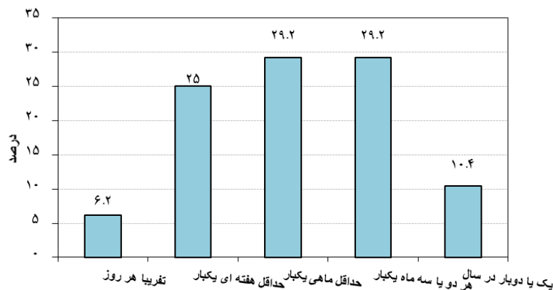
نمودار ۲. میزان استفاده پاسخگویان از اینترنت برای جستجوی اطلاعات سلامت (برحسب درصد).