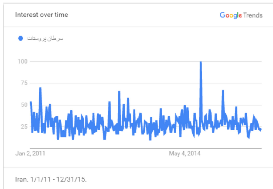
نمودار ۱. شاخص حجم جستجوی کلیدواژه «سرطان پروستات»

در نمودار (۲)، شاخص حجم جستجوی کلیدواژه « prostate cancer » در دوره زمانی یک ژانویه ۲۰۱۱ تا سی و یک دسامبر ۲۰۱۵ میلادی به تصویر کشیده شده است. طبق نمودار، یافته‌های حاصل از گوگل ترندز در این کلیدواژه نشان می‌دهد حجم جستجوی کاربران در موتور جستجوی گوگل بین سال‌های ۲۰۱۱ تا ۲۰۱۵ میلادی شیب نزولی داشته است.