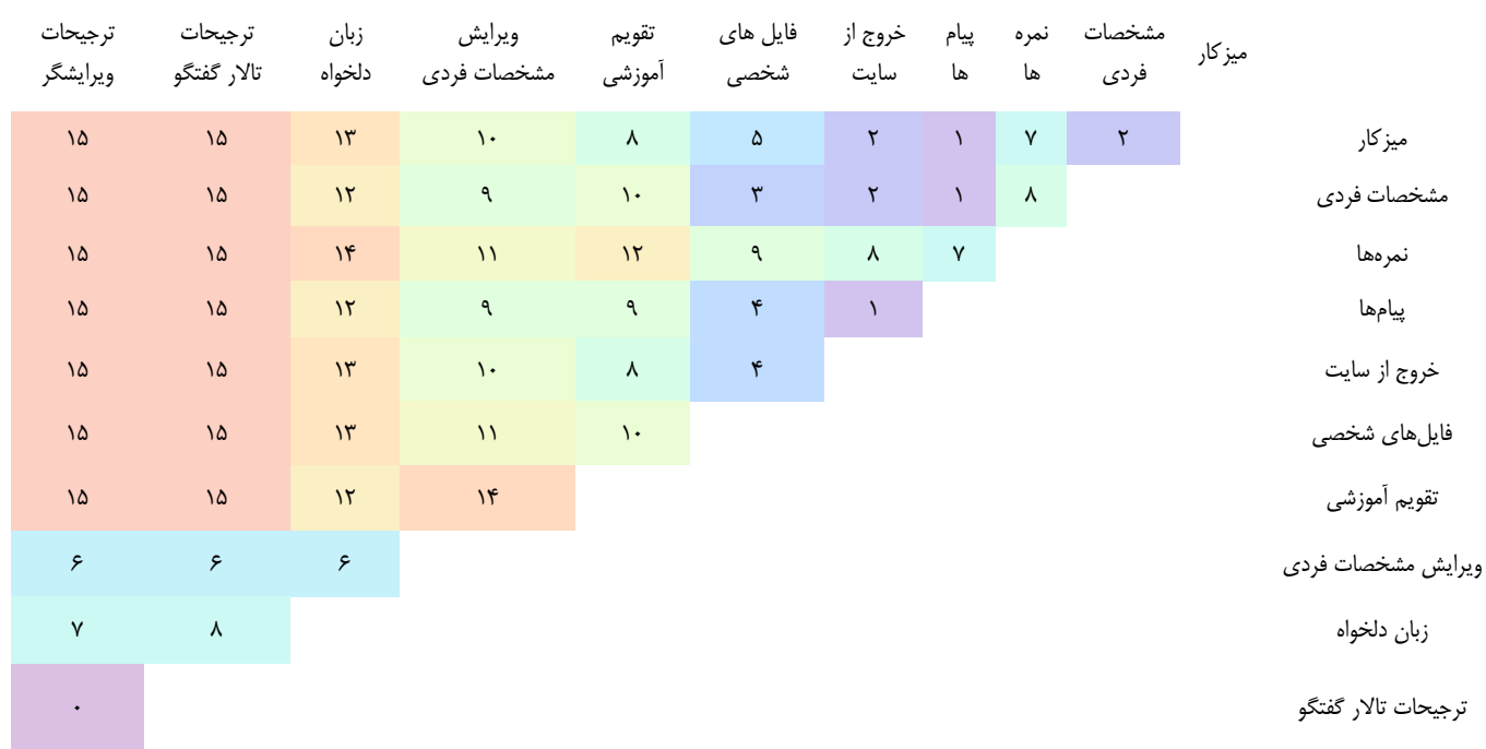
نمودار ۱. بخشی از نمودار ماتریس فاصله کارت‌ها

و همچنین در ادامه، قسمتی از یافته‌های ماتریس فاصله نشان داده شده است، اعداد نمودار نشانگر اختلاف بین کارت‌ها در هر جفت است. هرچه عدد پایین‌تر باشد، دو کارت شباهت بیشتری دارند و هرچه تعداد آن بیشتر باشد، مقادیر متفاوت‌تر هستند، بنابراین همان گونه که مشاهده می‌شود به عنوان مثال «ترجیحات گفتگو» با «ترجیحات ویرایشگر» بیشترین شباهت را دارند و در عین حال «ترجیحات گفتگو» با «میزکار» بیشترین میزان تفاوت را از نظر شرکت‌کنندگان پژوهش داشته‌اند.