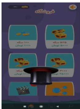
شکل ۶ پرداخت درون‌برنامه‌ای