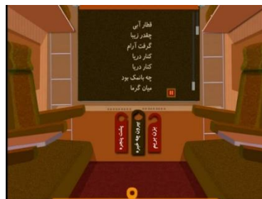
شکل ۴. صفحه اصلی کتاب قطار آبی: دریا

شعرها و تصاویر نسخه تعاملی و نسخه چاپی مجموعه قطار آبی یکی هستند اما کتاب برای نسخه تعاملی بازنویسی شده است. پرده پنجره در قطار هات اسپات است. با ضربه زدن روی آن پرده روی پنجره کشیده می‌شود و متن شعر روی آن ظاهر می‌شود. براساس انتخاب پیشین خواننده، این متن را یا راوی یا خودش خواهد خواند. سه هات اسپات دیگر نیز در نظر گرفته شده‌اند (شکل ۴): بزن بریم (با ضربه‌زدن روی آن قطار حرکت می‌کند)، بیرون چه خبره (متناسب با کتاب تصاویری متحرک از کوه، جنگل یا دریا نشان داده می‌شود. در این بخش جلوه‌های صوتی و هات اسپات‌های جدیدی در نظر گرفته شده است) و پشت پنجره (با انتخاب این مورد تصویری بزرگ‌نمایی شده از منظره پشت پنجره نمایش داده می‌شود).