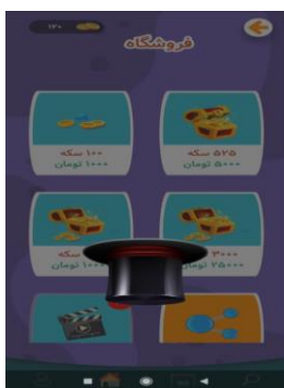
شکل ۶ پرداخت درون‌برنامه‌ای