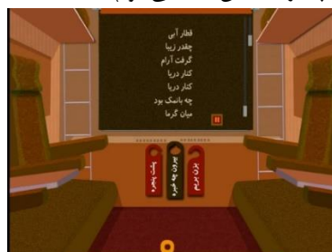
شکل ۴. صفحه اصلی کتاب قطار آبی: دریا

شعرها و تصاویر نسخه تعاملی و نسخه چاپی مجموعه قطار آبی یکی هستند اما کتاب برای نسخه تعاملی بازنویسی شده است. پرده پنجره در قطار هات اسپات است. با ضربه زدن روی آن پرده روی پنجره کشیده می‌شود و متن شعر روی آن ظاهر می‌شود. براساس انتخاب پیشین خواننده، این متن را یا راوی یا خودش خواهد خواند. سه هات اسپات دیگر نیز در نظر گرفته شده‌اند (شکل ۴): بزن بریم (با ضربه‌زدن روی آن قطار حرکت می‌کند)، بیرون چه خبره (متناسب با کتاب تصاویری متحرک از کوه، جنگل یا دریا نشان داده می‌شود. در این بخش جلوه‌های صوتی و هات اسپات‌های جدیدی در نظر گرفته شده است) و پشت پنجره (با انتخاب این مورد تصویری بزرگ‌نمایی شده از منظره پشت پنجره نمایش داده می‌شود).