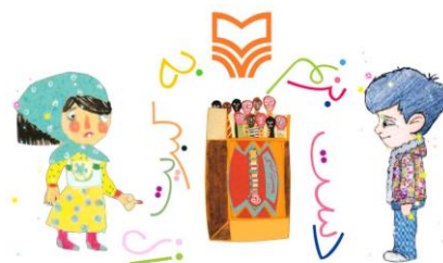
شکل ۱۰. انتخاب راوی

شخصیت‌ها صحبت می‌کنند. در سه کتاب: دست بزنم به کبریت، دست بزنم به چاقو و دست بزنم به قلیون خواننده می‌تواند تعیین کند شعر با صدای دخترانه یا صدای پسرانه خوانده شود (شکل ۱۰). در همین سه کتاب پیش از وارد شدن به برنامه به خواننده آموزش داده می‌شود که نقاط قابل لمس و ضربه‌زدن (هات اسپات‌ها) در صفحه از نظر ظاهری چه ویژگی‌هایی دارند (شکل ۱۱). در سایر کتاب‌های تعاملی این ناشر قسمت‌های هات اسپات مشخص نبودند و بر حسب اتفاق مورد شناسایی قرار می‌گرفتند.