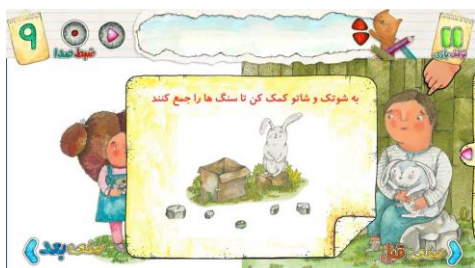
شکل ۹. نمونه تعامل در کتاب بگذار فکر کنم از مجموعه شوتک

بخشی برای درج نظر خواننده در نظر گرفته شده است ولی نظرات در این بخش ثبت نمی‌شوند.