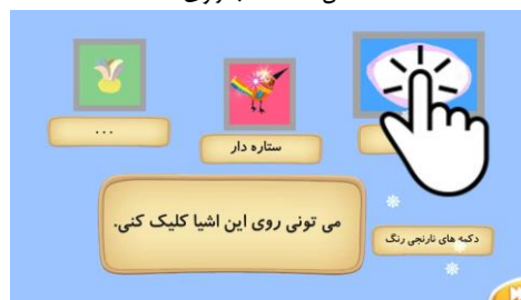
شکل ۱۱. آموزش نقاط هات اسپات

راهنماهای مناسب برای حرکت در صفحات کتاب در نظر گرفته شده است. در برخی از کتاب‌ها جورچینی از شخصیت‌ها یا صفحات کتاب برای بازی خواننده در نظر گرفته شده است. این جورچین در روند داستان تأثیری ندارد و فقط جنبه سرگرمی برای خواننده دارد و نمی‌توان آن را یک کتاب‌بازی در نظر گرفت.