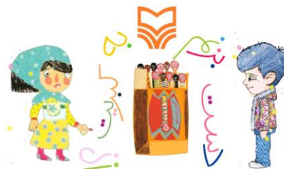
شکل ۱۰. انتخاب راوی

شخصیت‌ها صحبت می‌کنند. در سه کتاب: دست بزنم به کبریت، دست بزنم به چاقو و دست بزنم به قلیون خواننده می‌تواند تعیین کند شعر با صدای دخترانه یا صدای پسرانه خوانده شود (شکل ۱۰). در همین سه کتاب پیش از وارد شدن به برنامه به خواننده آموزش داده می‌شود که نقاط قابل لمس و ضربه‌زدن (هات اسپات‌ها) در صفحه از نظر ظاهری چه ویژگی‌هایی دارند (شکل ۱۱). در سایر کتاب‌های تعاملی این ناشر قسمت‌های هات اسپات مشخص نبودند و بر حسب اتفاق مورد شناسایی قرار می‌گرفتند.