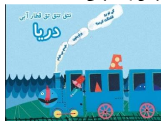
شکل ۵. صفحه اول کتاب قطار آبی: دریا استدیو بازی‌سازی یوزپا

در این مجموعه نیز برای شروع خواننده باید بتواند کلمات را بخواند (شکل ۵). مخاطب با ضربه‌زدن روی تصاویری که هات اسپات هستند (یا در مواردی کشیدن) آن‌ها را به حرکت در می‌آورد یا ظاهرشان را تغییر می‌دهد