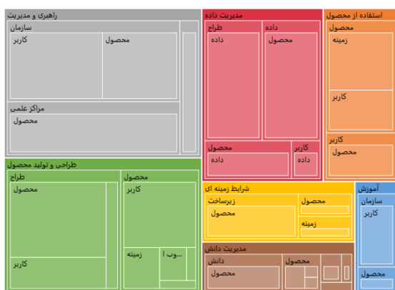
شکل ۲. هم‌پیوندهای همزیستی انسان-فناوری معنایی، به همراه عاملیت‌ها