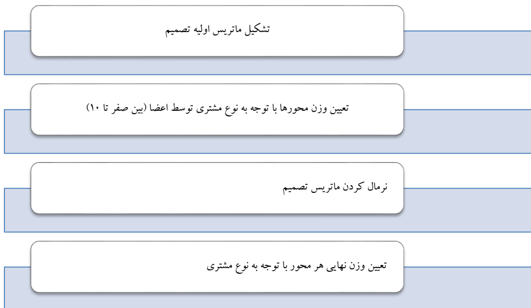
شکل ۱- مراحل تعیین وزن محورها با توجه به نوع مشتری

آن نوع مشتری ( G ، B و C ) قرار داشتند و هریک از آنها می‌بایست اهمیت سه محور را در مقابل این سه نوع مشتری تعیین نماید و برای نرمال کردن آن وزن هریک تقسیم بر مجموع اهمیت‌های نوع مشتری شد که در نهایت مجموع وزنی آن‌ها یک می‌شود. بدین صورت از نگاه هریک از