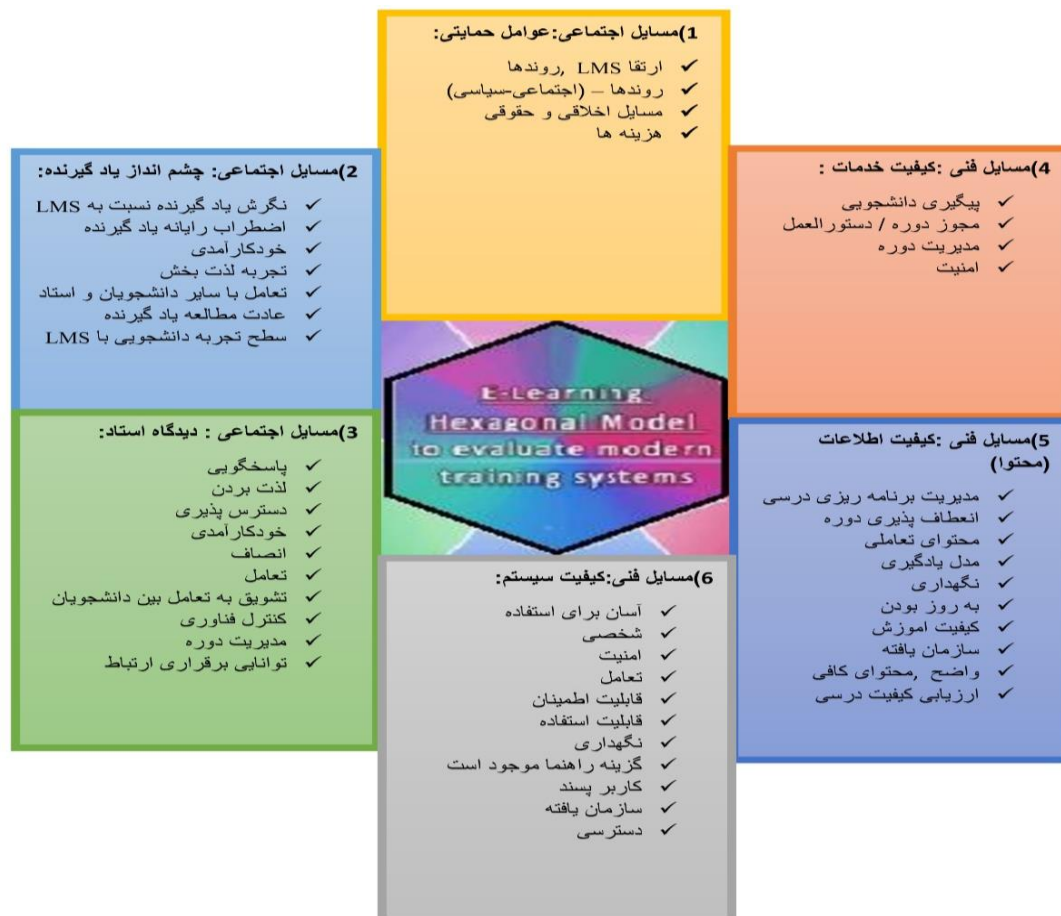
شکل (۱). مدل مفهومی آموزش الکترونیکی شش ضلعی هلام (اوزکان، ۲۰۰۹)

سایر دانش‌آموزان و معلم، عادت مطالعه یادگیرنده، سطح تجربه دانشجویی با آلام اس)، ۵. نگرش استاد (پاسخگویی، لذت بردن، اطلاعاتی بودن، خودکارآمدی، انصاف، تعامل، تشویق به تعامل بین دانشجویان، کنترل فناوری، مدیریت دوره، توانایی برقراری ارتباط)، ۶. مسائل حمایتی (ارتقای آلام اس، روندها (اجتماعی-سیاسی)، مسائل اخلاقی و حقوقی، هزینه‌ها) (اوزکان و کوسه‌لر ۸ ، ۲۰۰۹).