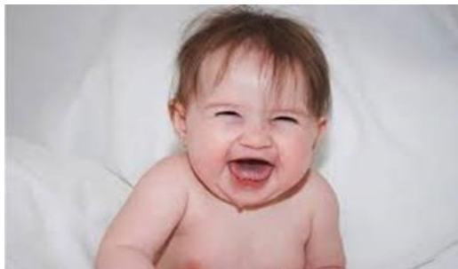
شکل ۲. نمونه‌ای از صحنه‌های استفاده شده جهت القای خلق مثبت و منفی