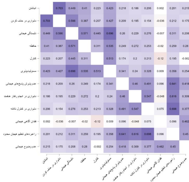
جدول ۲. شاخص‌های همسانی درونی پرسشنامه احتکار دیجیتال و زیرمقیاس‌های آن