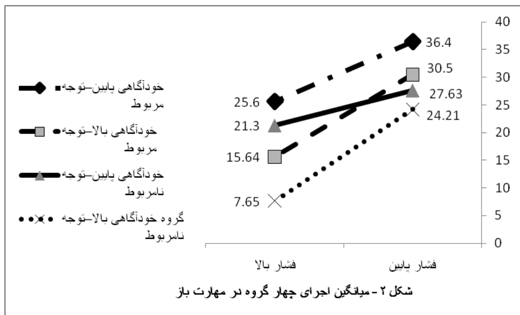
شکل ۲- میانگین اجرای چهار گروه در مهارت باز

شرایط فشار بالا جهت تمرکز توجه از علائم مربوط به تکلیف به علائم نامربوط به تکلیف، تغییر می‌کند. برای تکالیفی که نیازی به توجه کافی ندارند، حواسپرتی تحت شرایط فشار بالا می‌تواند انسداد را تسکین دهد (بامیستر، ۱۹۸۴؛ بیلک و همکاران، ۲۰۰۱؛ سدرتی، ۲۰۰۷؛ لند، ۲۰۰۷).