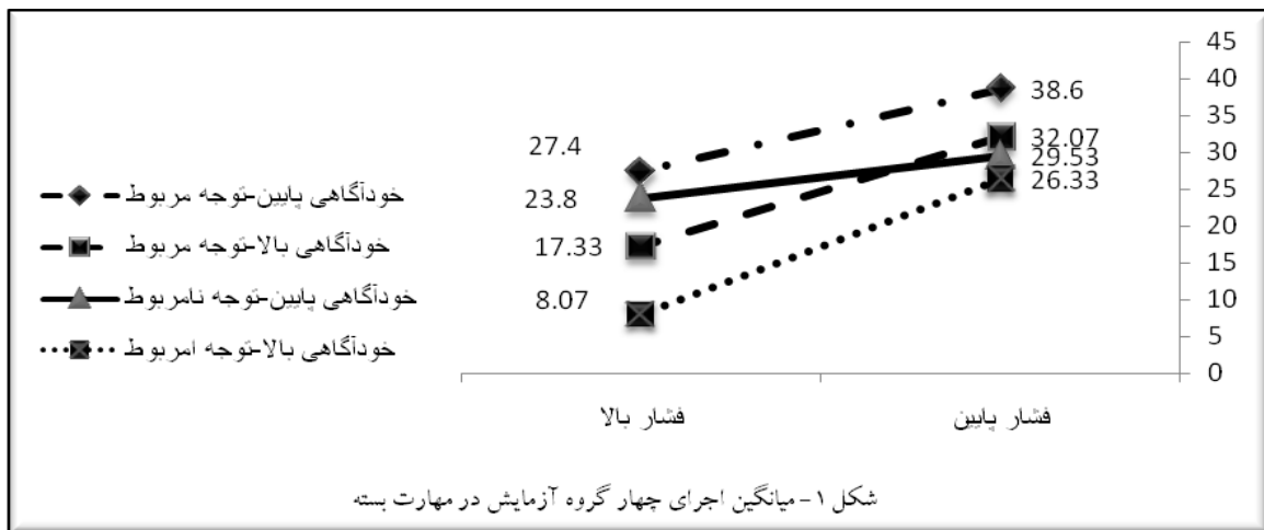
شکل ۱- میانگین اجرای چهار گروه آزمایش در مهارت بسته