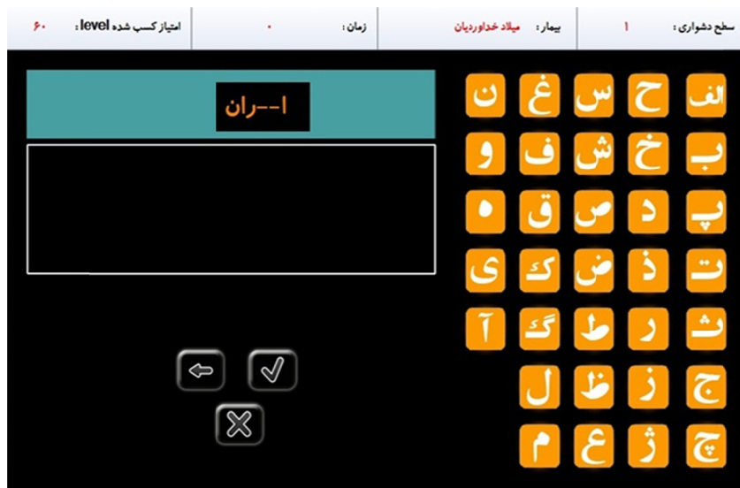
تصویر ۱- نمونه‌ای از تمرینات جهت تقویت حافظه آینده‌نگر

سطح (ب) عدم تشویق حدس زدن و استفاده از روش آزمایش و خطا (ج) ندادن فرصت اشتباه به فرد با دادن سرخ‌های بیشتر برای بازیابی تا رسیدن به پاسخ درست (د) ارائه نمونه و مثال‌های کافی قبل از اینکه از فرد خواسته شود تکلیف اصلی را انجام دهد (و) تصحیح فوری خطاها.