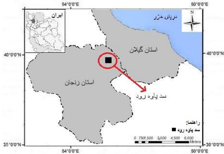
شکل ۱. موقیت مکانی سد پاورود زنجان