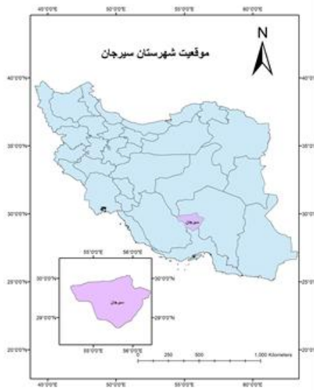
شکل ۱. موقعیت شهرستان سیرجان روی نقشه