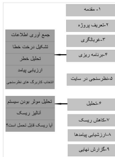
شکل ۳. فرآیند ارزیابی ریسک در سدها به روش RAM-D [۱۳]

روش RAM-D از روش تحلیل درخت خطا بهره می‌گیرد و اطلاعات مورد نیاز را از متخصصان، منابع موجود و سایت‌های اینترنتی فراهم می‌کند و طرح و نقشه اولیه سدها به شدت بستگی به این موارد دارد. RAM-D فرآیند زنده و پویا است که با تغییر محیط تهدید نیاز به بازبینی و تغییر دارد [۱۳]. در شکل ۳ مراحل اجرای ارزیابی ریسک به روش RAM-D نشان داده شده است.