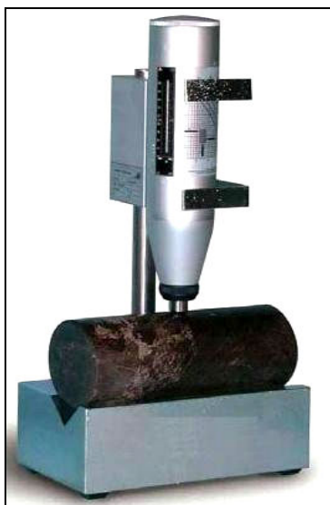
شکل ۱. نحوه استفاده از چکش اشمیت

عدد بازگشتی را می‌توان با منحنی کالیبره موجود بر روی چکش به مقاومت فشاری سنگ ارتباط داد. منحنی کالیبره برای مقاومت فشاری در این روش دارای حساسیت بسیار زیادی است و تحت تأثیر عوامل متعددی از جمله نوع سنگ، وزن واحد حجم، میزان تخلخل، درصد رطوبت، درجه هوازدگی و امتداد قرارگیری چکش نسبت به سطح سنگ به‌هنگام انجام آزمایش و استفاده از چکش اشمیت است [۱].