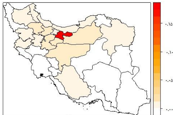
نقشه (۱). اثرات سرریز سرمایه‌گذاری صنعتی استان تهران بر سایر استان‌های کشور

ضریب اثرگذاری غیرمستقیم (اثرات سرریز) هر یک از متغیرها، را می‌توان برای هر یک از استان‌ها به صورت مجزا بدست آورد. تفکیک استانی این اثرات، دید بهتری از اثرات سرریز به برنامه‌ریزان و سیاست‌گذاران ملی می‌دهد. در این بخش، تنها اثرات سرریز سرمایه‌گذاری صنعتی که مورد هدف این تحقیق می‌باشد بطور خاص و جزئی به تفکیک هریک از استان‌ها بیان می‌شود. بررسی این اثرات به تفکیک هر استان نشان می‌دهد که بیشترین اثرات سرریز سرمایه‌گذاری صنعتی، مربوط به استان تهران است. اثرات سرریز سرمایه‌گذاری صنعتی این استان بر سایر استان‌ها به عنوان نمونه، در نقشه شماره ۱ آمده است.