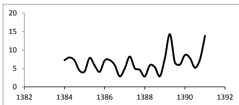
نمودار ۲. روند شاخص عدم تطبیق مهارت برای کل کشور از بهار سال ۱۳۸۴ تا بهار سال ۱۳۹۱ منبع: عیسی‌زاده و نائینی (۱۳۹۵)

مطالعه حاضر به بررسی دقیقتر وضعیت فعلی بازار کار کشور از نظر عرضه و تقاضای مهارت می‌پردازد؛ در این راستا و به منظور کمی کردن مسئله عدم تطبیق مهارت، از اطلاعات موجود در طرح آمارگیری نیروی کار از سال ۱۳۸۴ تا سال ۱۳۹۱ استفاده شده است. روند عدم تطبیق مهارت از بهار سال ۱۳۸۴ تا بهار سال ۱۳۹۱ برای کل کشور در نمودار زیر نشان داده شده است. همانگونه که ملاحظه می‌گردد، عدم تطبیق مهارت از مقدار ۷/۲۷ در بهار سال ۱۳۸۴ به میزان ۱۳/۸۳ در بهار سال ۱۳۹۱ افزایش یافته است.