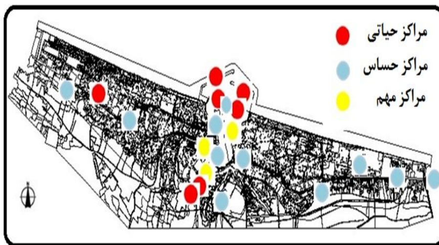
شکل (۳) نحوه پراکنش مراکز ثقل شهر بر اساس روش جدول ارزیابی

پس از تعیین مراکز استراتژیک توزیع فضایی و پراکندگی جغرافیایی آنها مورد بررسی قرار گرفت تا بخش هایی از شهر که واجد بیشترین کاربری های استراتژیک و نیز آسیب پذیری بیشتری هستند شناسایی شوند. این اطلاعات به صورت نقشه در شکل ۳ قابل مشاهده است.