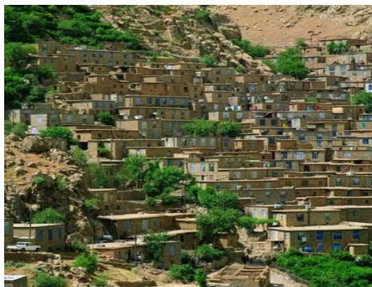
شکل (۲) نمای عمومی روستای هجیج

محدوده مطالعه در این تحقیق، روستای هجیج از توابع بخش نوسود شهرستان پاوه در استان کرمانشاه است که در ۳۴ کیلومتری شهر پاوه و ۱۲۳ کیلومتری کرمانشاه قرار دارد. این روستا دارای ۱۸۰ خانوار، معادل ۶۰۳ نفر جمعیت است (مرکز آمار ایران، ۱۳۹۰) که از شمال غرب و جنوب به کوه‌های سالان و شاهو محدود است که با اقلیمی معتدل و کوهستانی، در بهار و تابستان آب و هوای مطبوعی دارد و در پاییز و زمستان سرد است. اگرچه اسناد معتبری در مورد تاریخ روستای هجیج در دست نیست، اما وجود امامزاده عبیدالله معروف به کوسه هجیج بیانگر آن است که این روستا سابقه تاریخی دیرینه‌ای دارد و قدمت آن به بیش از ۵۰۰ سال می‌رسد. جاذبه‌های گردشگری این روستا ترکیبی از میراث طبیعی و فرهنگی از جمله شامل چشم‌اندازهای کوهستانی و سبز پیرامون روستا، رودخانه دایمی، بافت کالبدی روستا با معماری پله‌کانی، مصالح ساختمانی بوم‌آورد، ویژگی‌های مردم‌شناختی مانند آیین‌ها و آداب کردی، پوشش سنتی مردان و زنان، صنایع دستی خاص نظیر گیوه‌بافی و ... است (شکل ۲).