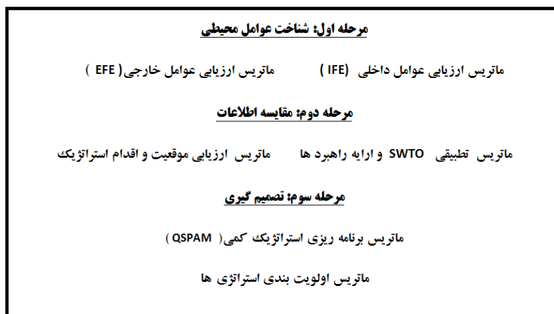
شکل (۱). روش شناسی و چهارچوب تحلیلی برنامه ریزی استراتژیک

این پژوهش با استفاده از روش شناسی توصیفی و تحلیلی و از طریق مطالعات اسنادی و میدانی انجام پذیرفته است. همچنین در پژوهش حاضر روش جمع آوری اطلاعات اسنادی بصورت مراجعه و فیش برداری از مدارک و اسناد کتابخانه‌ای و همچنین در مطالعات میدانی از روش نمونه برداری (روش کوکران)، مشاهده مستقیم، مصاحبه، تهیه عکس، فیلم و برای تجزیه و تحلیل اطلاعات از تکنیک استراتژیک SWOT و نرم افزارهای SPSS و EXCEL استفاده شده است. جامعه آماری مورد مطالعه در این مقاله را خبرگان و مسئولان دستگاهها و نهادهای مرتبط با گردشگری شهری تشکیل می دهند که تعداد ۷۰ نفر بعنوان نمونه انتخاب شده است. سپس باتوجه به تحلیل عوامل چهارگانه قوت، ضعف، تهدیدات و فرصت ها، پرسشنامه ای حاوی ۲۰ پرسش پنج گزینه ای به دست آمد در این بخش برای تکمیل پرسشنامه ها از ۷۰ نفر از خبرگان و مسئولان دستگاهها و نهادهای مرتبط با گردشگری شهر مورد مطالعه کسب نظر انجام شد. پرسش ها بر اساس طیف لیکرت شامل ۵ گزینه خیلی زیاد - زیاد - متوسط - کم و خیلی کم بود. جهت تجزیه و تحلیل اطلاعات و ارائه الگوی راهبردی توسعه توریسم شهری از روش تحلیلی SWOT استفاده شده است که در ابتدا با سنجش محیط داخلی و محیط خارجی شهر فهرستی از نقاط قوت، ضعف، فرصتها و تهدیدات مورد شناسایی قرار گرفت و سپس بوسیله نظر خواهی از خبرگان و مسئولان امر و وزن دهی به هرکدام از این مسائل و سپس محاسبه و تحلیل آنها، اولویت ها مشخص شد و جهت برطرف نمودن یا تقلیل نقاط ضعف و تهدیدها و تقویت و بهبود نقاط قوت و فرصتهای موجود در ارتباط با گسترش گردشگری شهری در شهر شهرکرد، در نهایت استراتژی های مناسبی ارائه شده است. مراحل شناسایی، ارزیابی و وزن دهی به عوامل چهارگانه در تحلیل SWOT عبارتند از شکل (۱):