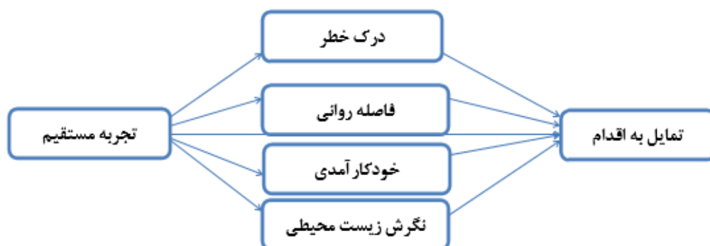
شکل (۱). الگوی علی تعیین روابط بین عوامل مؤثر بر تمایل به اقدام جهت کاهش تغییرات اقلیمی

زمانی در (ذهن) یک فرد در ارتباط است. این تئوری بین فاصله روانی درک شده با تفسیر ذهنی از حوادث رابطه برقرار می‌کند. از آنجا که نیت عمومی برای انجام یک رفتار مثلاً "من قصد دارم اقداماتی برای متوقف کردن گرمایش جهانی انجام دهم" منعکس کننده سطح بالاتری از انتزاع هستند و برای فرد بیشتر جنبه روانی دارند؛ هنگامی که در مورد گرمایش جهانی در سطح انتزاعی فکر می‌شود، افراد بر روی تصویری بزرگتر و ویژگی‌های اصلی این پدیده که یک نمای کلی از وضعیت را ارائه می‌دهد، متمرکز می‌گردند. اما در مقابل نیت در مورد اقدامات خاص مانند (من سعی دارم که کمتر از تهویه کننده‌های هوا در تابستان و گرم کننده‌های هوا در زمستان استفاده کنم) منجر می‌شود مردم بر روی جزئیات گرمایش جهانی تمرکز کنند، به گونه‌ای که تجربیات شخصی برجسته‌تر می‌گردد (برومل و همکاران، ۲۰۱۵؛ ۶۸). از این رو، انتظار می‌رود تجربه شخصی فاصله روانی را و همچنین فاصله روانی تمایل یا نیت افراد را در مورد اقدامات خاص جهت کاهش تغییرات اقلیمی تحت تأثیر قرار دهد. شکل (۱) الگوی علی پیشنهادی جهت تعیین روابط بین عوامل مؤثر بر تمایل به اقدام جهت کاهش تغییرات اقلیمی را نشان می‌دهد.