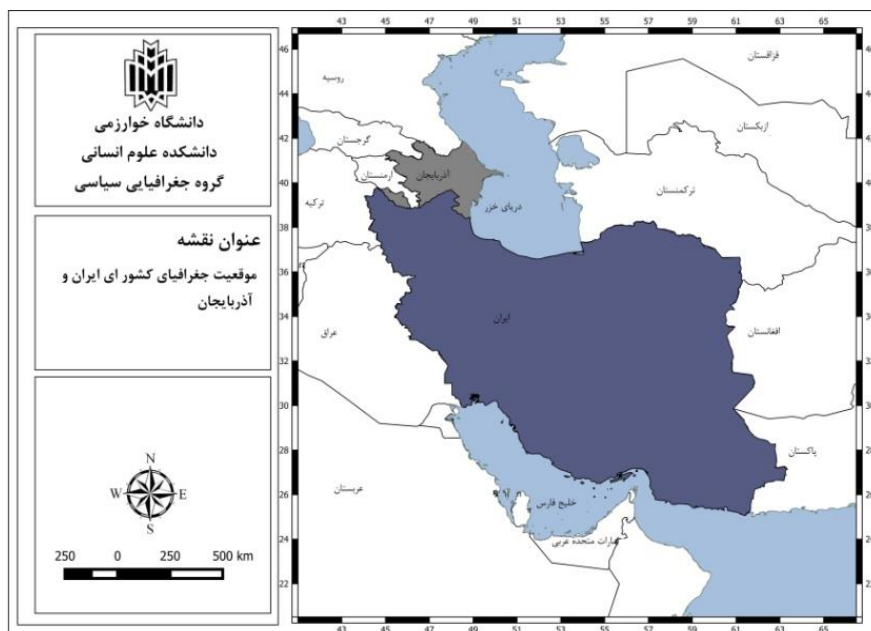
شکل (۱). موقعیت جغرافیایی ایران و جمهوری آذربایجان