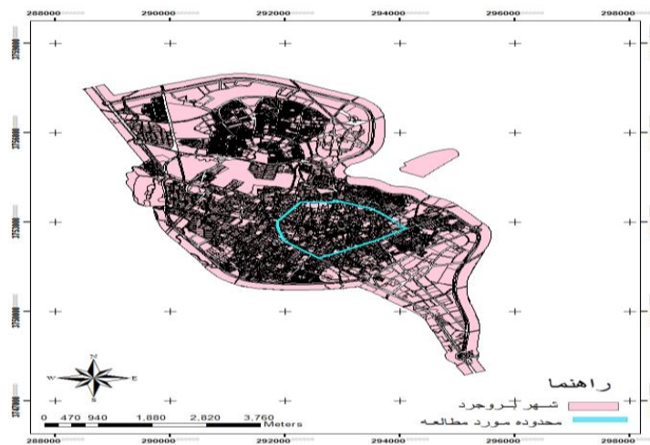
شکل (۱) نقشه موقعیت مکانی محدوده مورد مطالعه

قابل باز سازی است. ساختار کالبدی شهر بروجرد در دوران قبل از قاجار، شعاعی بوده و برمبنای مرکزیت بازار بوده است که عناصر اصلی آن شامل چهار محله صوفیان، دودانگه، رازان قدقون و یخچال، بازار و مسجد جامع، گذرهای اصلی منتهی به راه های کاروان رو و قلعه قدیمی شهر بوده است. بخش مرکزی شهر بروجرد: محدوده ای با وسعت ۲۷۱/۸ هکتار است که در مرکز جغرافیای شهر بروجرد واقع و با توجه به وسعت محدوده قانونی شهر بروجرد (۲۷۸۳ هکتار) ۱۰ درصد از شهر را به خود اختصاص داده است. شکل (۱). و در سال ۱۳۸۵ دارای جمعیت برابر با ۳۶۷۲۶ نفر، به لحاظ موقعیت نسبی، این محدوده توسط خیابان های فروردین، صامت بروجردی و ۳۵ متری طالقانی از شمال و شمال شرقی خیابان های امام حسین، سپاه و امام خمینی از جنوب شرقی و جنوب خیابانهای خرم (فردوسی) و امام خمینی از غرب و جنوب غرب و خیابان های کاشانی (گل سرخی) و بهار از غرب محدود شده است. اولین طرح شهری جهت هدایت و گسترش فیزیکی شهر طرح جامع بوده است که توسط مهندسین مشاور در فاصله سالهای ۱۳۵۶، ۱۳۶۰ تهیه شده است ( مهندسین مشاور طرح کاوش ، ۱۳۷۳).