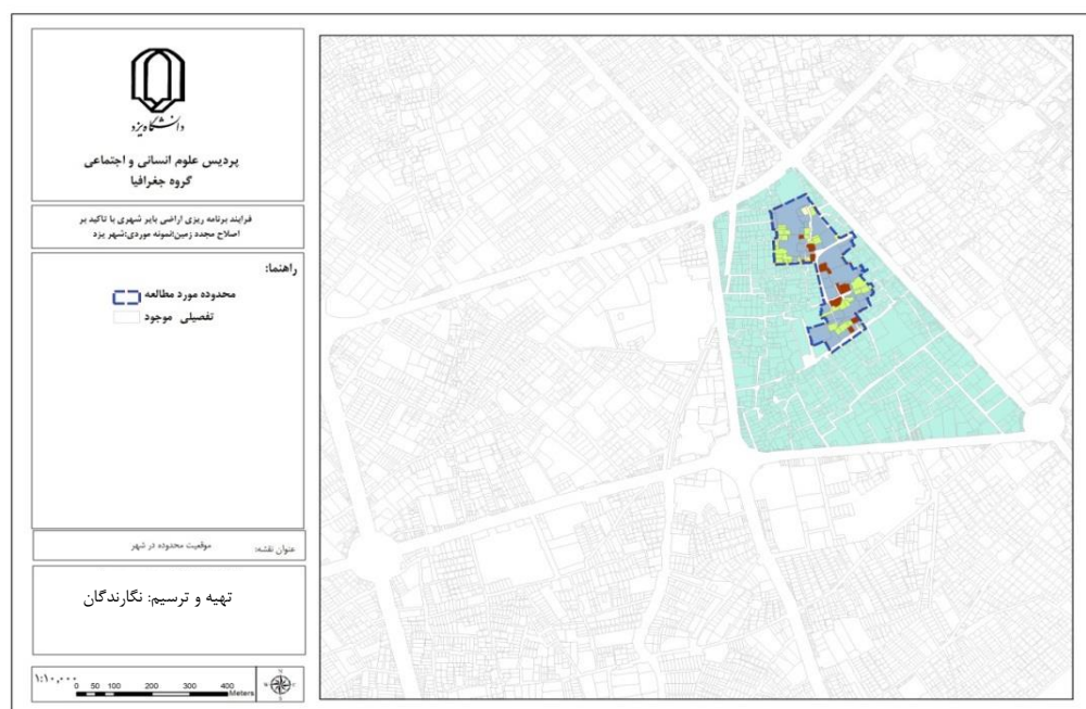
شکل (۱). موقعیت محدوده مورد مطالعه در شهر یزد

تحقیق حاضر از نظر هدف، یک تحقیق توسعه‌ای- کاربردی می‌باشد. از نظر گردآوری داده‌ها و اطلاعات و روش تجزیه و تحلیل یک تحقیق توصیفی- تحلیلی بوده که در بین انواع تحقیقات توصیفی، از نوع مطالعه موردی می‌باشد. اطلاعات مورد نیاز به طور عمده از منابع کتابخانه‌ای، نتایج سرشماری‌ها و طرح‌های توسعه شهری تهیه شده توسط مهندسين مشاور و قسمتی از طریق پیمایش گردآوری گردیده است. در ادامه، محدوده‌ای از شهر یزد که به نظر می‌رسد قابلیت استفاده از روش اصلاح مجدد در آن وجود دارد انتخاب و سپس محاسبات مربوط به این روش با استفاده از نرم‌افزارهای GIS و EXCEL انجام و طرح پیشنهادی برای محدوده ارائه گردیده است. در فرآیند اصلاح مجدد، ابتدا بایستی نرخ قابلیت محدوده محاسبه شود. اگر نرخ قابلیت مجموعه بزرگتر از عدد ۲ برآورد گردد، مطالعه میزان توجیه‌پذیری محدوده برای اصلاح مجدد زمین باید انجام گیرد. در مرحله بعد نرخ توجیه‌پذیری محدوده ( \alpha ) محاسبه می‌گردد. چنانچه \alpha < 1 باشد، این دسته از پروژه‌ها، ممکن است نیازمند کمک‌های مالی باشند. اگر 1/5 < \alpha < 1 باشد، بدان معناست که احتمال ناکامی طرح و وقوع نتایج مغایری با تراز مالی تدوین شده وجود دارد. در صورت \alpha > 1/5 ، بدان معناست که محدوده طرح، مناسب توسعه است. در ادامه بقیه شاخص‌های مورد نیاز محاسبه می‌گردند. جدول (۱) تمامی شاخص‌ها و نحوه محاسبه آنها را نشان می‌دهد.