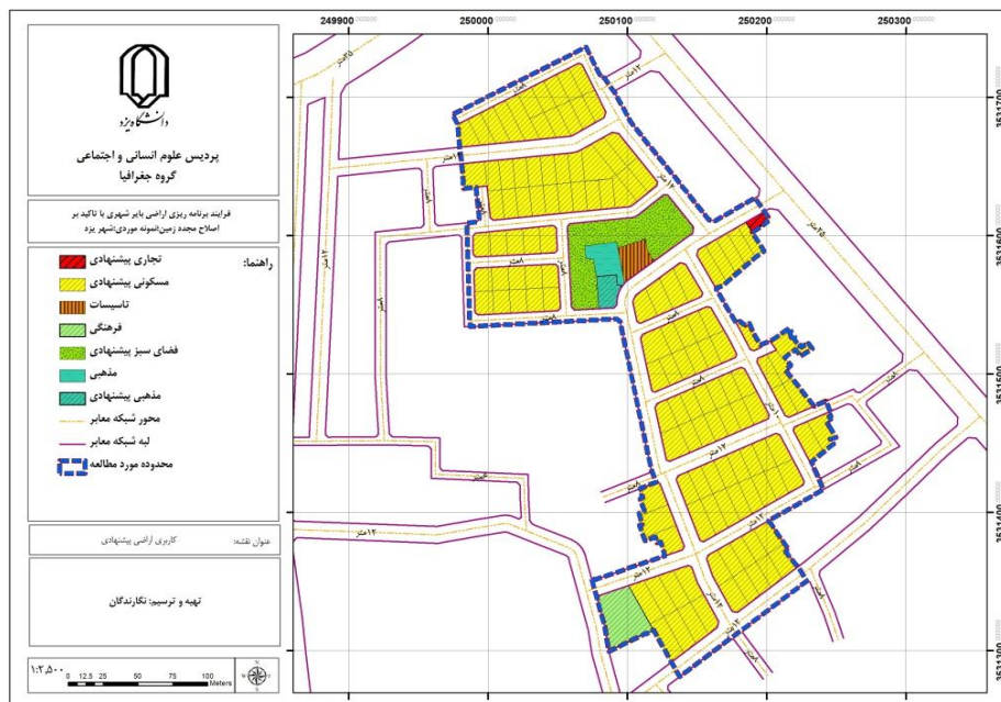
شکل (۳). کاربری اراضی پیشنهادی

در محدوده مورد مطالعه، ۹۲ قطعه زمین وجود دارد که در ابتدا برای انجام محاسبات، باید شماره‌گذاری شوند. شکل (۳) کاربری اراضی پیشنهادی را نشان می‌دهد.