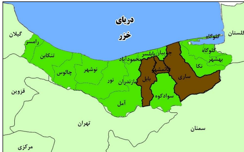
شکل (۱). موقعیت محدوده مورد مطالعه