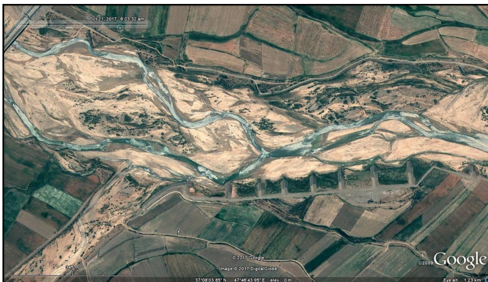
شکل (۲). فرم شریانی رودخانه قزل اوزن در ترانسکت شماره ۱۳

با توجه به جدول (۱) بیشتر مسیر رودخانه قزل اوزن در بازه مورد مطالعه از الگوی سینوسی تبعیت می کند به طوری که از ۲۴ ترانسکت، تعداد ۱۵ ترانسکت الگوی سینوسی دارد. البته در برخی از بخش های مسیر رودخانه، گرایش به الگوی مستقیم نیز دیده می شود که تعداد ۶ ترانسکت از این الگو تبعیت می کند. گرایش به الگوی مئاندری در این بازه از مسیر رودخانه کم و تنها در ۳ ترانسکت دیده می شوند. رودخانه قزل اوزن در بازه مورد مطالعه، به جهت مورفولوژی محیط اطراف مجرای رودخانه، وضعیت همگنی ندارد. در حالت کلی می توان ۲ تیپ شاخص را در این ارتباط مورد شناسایی قرار داد. تیپ اول فرم کوهستانی است که بیشتر مسیر رودخانه در این فرم جریان دارد. در این بخش ها، رودخانه غالباً در معبری تنگ و باریک طی مسیر می کند و یال های دامنه در سواحل راست و چپ رودخانه با شیب تند به مجرا ختم می شود. تیپ دوم، فرم دشت سیلابی است که بخش کمتری از رود در آن جاری است. در این مناطق به جهت پهن تر شدن مجرا، کاهش شیب دامنه ها و وجود زمین های قابل کشت، سواحل اطراف به زیر کشت رفته اند و مناطق مسکونی شکل گرفته اند. از نظر شکل ظاهری رودخانه قزل اوزن در این قسمت، حالت شریانی دارد؛ زیرا پتانسیل حمل رسوبات آن بالا بوده و برای اتلاف انرژی مازاد، جریان در آن تمایل به گستردگی دارد. از این رو تهنشست مواد رسوبی کف به میزان فراوان صورت می یابد شکل (۲).