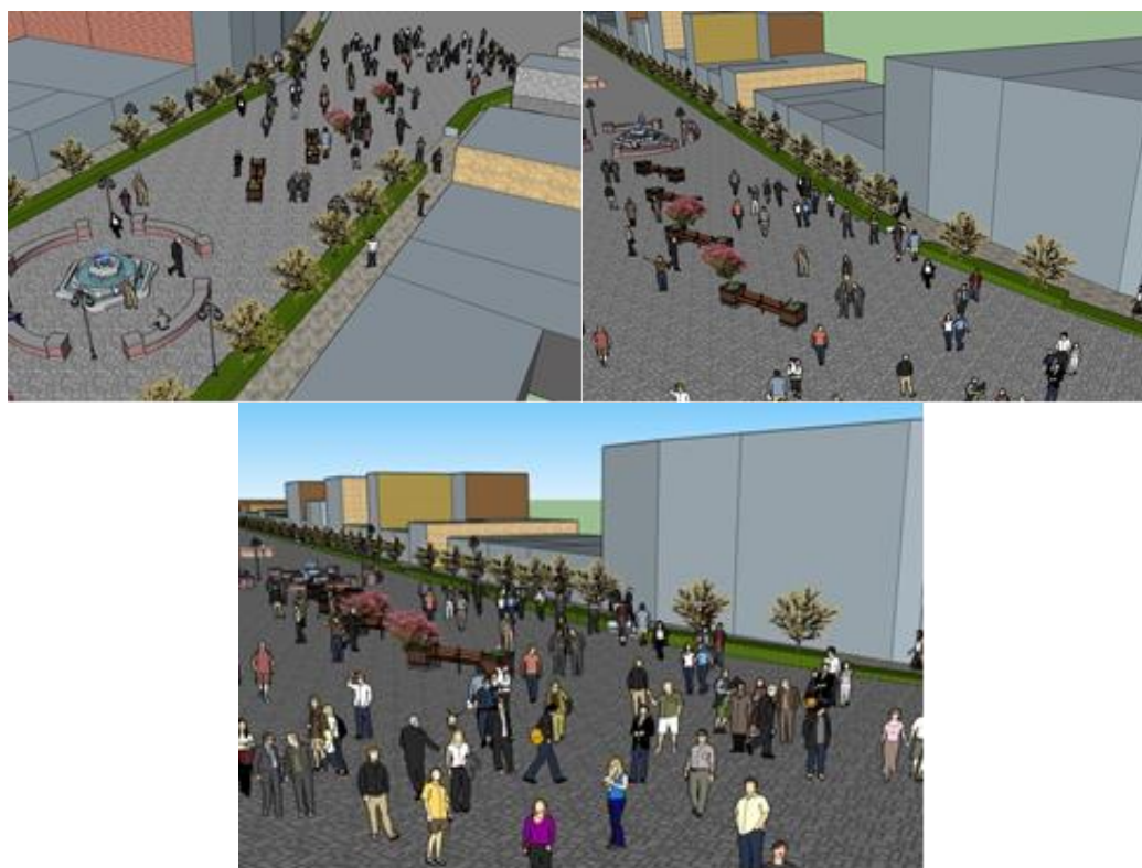
شکل (۷) طرح های پیشنهادی محدوده مورد مطالعه

شهری ونیز تصمیم مردم برای پیاده روی در یک مکان خاص اثر دارد را مشخص می نماید. انتخاب افراد برای پیاده روی و لذت از یک فضای شهری مانند پیاده راه می تواند بر اساس درک ذهنی آنها از فضا، یا ویژگی های محیطی فضای شهری صورت گیرد شکل (۷).