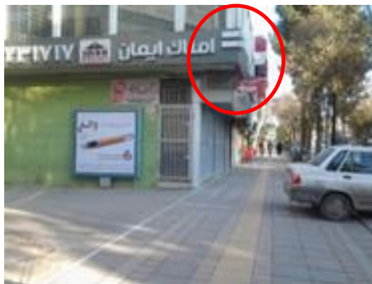
شکل (۴). پیش آمدگی بدنه ساختمان ها (نظیر بالکن، تراس و ...) در فضاهای شهری

برداری از این فضاها به عنوان انباری (محل نگهداری مواد غذایی، سوخت و ...) و خشک نمودن البسه ممنوع است. شکل (۳).