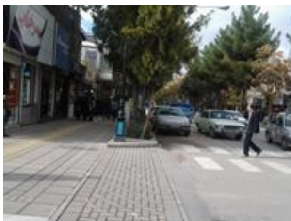
شکل (۶) اختلاف سطح (لبه، پله، سکو و ...) در مسیر عبور در معابر پیاده

ایجاد هرگونه اختلاف سطح (لبه، پله، سکو و ...) در مسیر عبور در معابر پیاده ممنوع است و تغییرات سطوح بایستی بوسیله شیب راهه و رمپ انجام شود. شکل (۶).