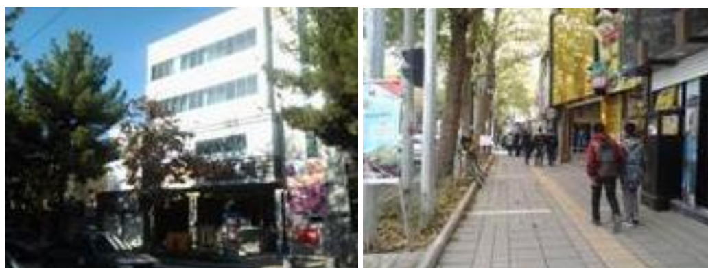
شکل (۳). تقسیم بنا به احجام متناسب با دانه بندی بخش تاریخی شهر

طرح و اجرای بناهای واقع در مناطق تاریخی شهر باید دارای مقیاس انسانی بوده و دانه بندی و ریخت شناسی مشابه بافت تاریخی شهر داشته باشد. در طراحی معماری بناهای کلان مقیاس، تقسیم بنا به احجام متناسب با دانه بندی بخش تاریخی شهر الزامی است.