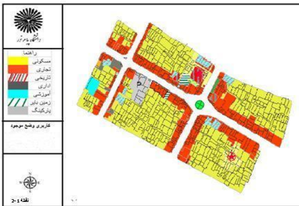
شکل (۱) بررسی کاربری‌های محدوده مورد مطالعه

ابتدا با استفاده از روش اسنادی و ابزاری همچون کتاب‌ها، مقالات، مجلات و ... به گردآوری اطلاعات مربوط به محدوده مورد مطالعه پرداخته و سپس با استفاده از روش غیر اسنادی (میدانی)، بازدید میدانی و تهیه عکس به تجزیه و تحلیل وضع موجود و ارائه راهکارهای مناسب پرداخته شد. سپس شاخص‌های کیفیت محیطی بررسی و تحلیل شده است، تا با تأکید بر ابعاد فرهنگی اجتماعی، به تأثیر پیاده راه بر تعاملات اجتماعی با استفاده از برداشت‌های میدانی و مصاحبه با ساکنان به جمع‌آوری داده‌ها پرداخته شده است.