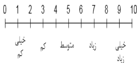
شکل (۴). مقیاس دوقطبی فاصله‌ای

پس از روشن شدن میزان اهمیت معیارها و شاخص‌ها، می‌باید امتیاز آن‌ها مشخص شود. برای تعیین امتیاز، از اطلاعات مربوط به جداول مقایسه وضع موجود منطقه (حین اجرا طرح) و طرح موردنظر استفاده شد. این اطلاعات حاصل تجزیه و تحلیل وضع موجود در منطقه و طرح CDS است که پیش‌از این بدان اشاره شد. به این صورت که پس از دریافت نظرات در قالب مصاحبه آزاد، امتیازدهی به معیارها انجام شد. برای اندازه‌گیری امتیاز اثرات مثبت و عوامل منفی بر هر شاخص و در نهایت معیار، از مقیاس دوقطبی فاصله‌ای استفاده شد. این اندازه‌گیری بر اساس یک مقیاس ۱۰ نقطه‌ای است که در آن صفر مشخص‌کننده حداقل ارزش ممکن و ۱۰ مشخص‌کننده حداکثر ارزش ممکن از اثرات عوامل مثبت بر معیارهای موردنظر است. در این مقیاس، نقطه وسط (۵) نقطه شکست مقیاس بین مطلوب و نامطلوب است، ضمناً از مقادیر ۲، ۴، ۶، و ۸ می‌توان در هنگامی استفاده کرد که حالت‌های میانه وجود دارد (زبردست و همکاران، ۱۳۹۲).