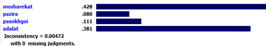
شکل (۳). ضرائب اهمیت معیارها

پس از روشن شدن میزان اهمیت معیارها و شاخص‌ها، می‌باید امتیاز آن‌ها مشخص شود. برای تعیین امتیاز، از اطلاعات مربوط به جداول مقایسه وضع موجود منطقه (حین اجرا طرح) و طرح موردنظر استفاده شد. این اطلاعات حاصل تجزیه و تحلیل وضع موجود در منطقه و طرح CDS است که پیش‌از این بدان اشاره شد. به این صورت که پس از دریافت نظرات در قالب مصاحبه آزاد، امتیازدهی به معیارها انجام شد. برای اندازه‌گیری امتیاز اثرات مثبت و عوامل منفی بر هر شاخص و در نهایت معیار، از مقیاس دوقطبی فاصله‌ای استفاده شد. این اندازه‌گیری بر اساس یک مقیاس ۱۰ نقطه‌ای است که در آن صفر مشخص‌کننده حداقل ارزش ممکن و ۱۰ مشخص‌کننده حداکثر ارزش ممکن از اثرات عوامل مثبت بر معیارهای موردنظر است. در این مقیاس، نقطه وسط (۵) نقطه شکست مقیاس بین مطلوب و نامطلوب است، ضمناً از مقادیر ۲، ۴، ۶، و ۸ می‌توان در هنگامی استفاده کرد که حالت‌های میانه وجود دارد (زبردست و همکاران، ۱۳۹۲).