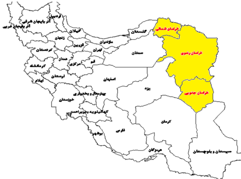
شکل (۱). موقعیت قرارگیری منطقه خراسان (سه استان خراسان شمالی، خراسان رضوی و خراسان جنوبی) در سطح کشور