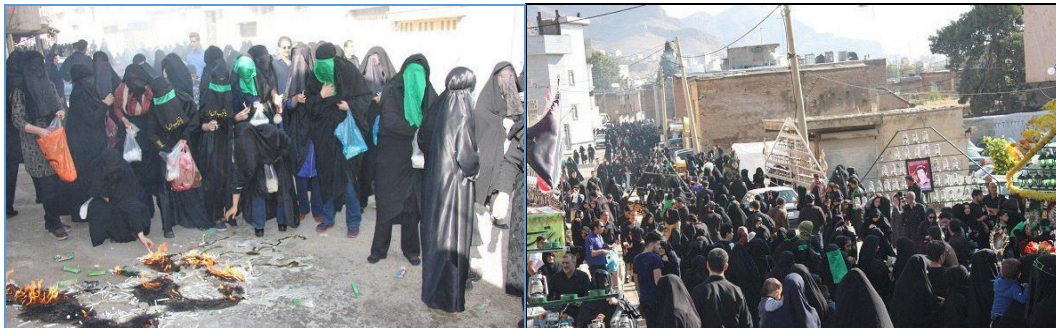
شکل (۱): افراد حاضر در مراسم چهل منبر شهرستان خرم‌آباد روز تاسوعای سال ۱۳۹۷