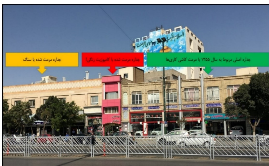
شکل (۷). سه نوع مرمت جداره در خیابان امام رضا (ع)

در شکل (۷) سه نوع مرمت ملاحظه می‌شود. بنای سمت راست، همان جداره اصلی (که مربوط به سال ۱۳۵۵ است) را حفظ نموده و آجرهای آن تمیز و کاشی‌کاری‌های مربوط به نما را احیاء و مرمت کرده است. بنای وسطی با نمای کامپوزیت پوشش داده شده است. بنای سمت چپ با سنگ پوشش داده شده است. بنای وسط و سمت چپ، نمای هویت‌مند، بومی و پایداری که در سال ۱۳۵۵ اجرا شده است را پوشش داده‌اند و همچون وصله‌ای ناهمخوان در جوار نمای اصلی قرار گرفته‌اند.