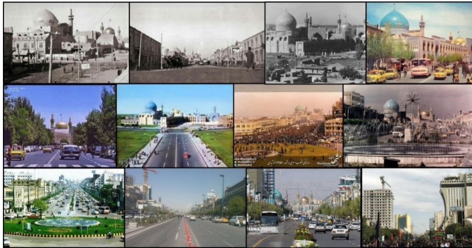
شکل (۲). منظر خیابان امام رضا (ع) در قرن اخیر

تعهد در بین مدیران، مسئولان، برنامه‌ریزان و طراحان شهری موجب این ناهماهنگی و بی‌نظمی در خیابان امام رضا (ع) شده است. در شکل (۲) منظر خیابان امام رضا (ع) در قرن اخیر آورده شده است.