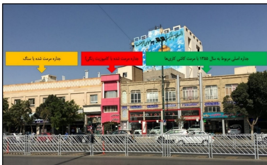
شکل (۷). سه نوع مرمت جداره در خیابان امام رضا (ع)

در شکل (۷) سه نوع مرمت ملاحظه می‌شود. بنای سمت راست، همان جداره اصلی (که مربوط به سال ۱۳۵۵ است) را حفظ نموده و آجرهای آن تمیز و کاشی‌کاری‌های مربوط به نما را احیاء و مرمت کرده است. بنای وسطی با نمای کامپوزیت پوشش داده شده است. بنای سمت چپ با سنگ پوشش داده شده است. بنای وسط و سمت چپ، نمای هویت‌مند، بومی و پایداری که در سال ۱۳۵۵ اجرا شده است را پوشش داده‌اند و همچون وصله‌ای ناهمخوان در جوار نمای اصلی قرار گرفته‌اند.