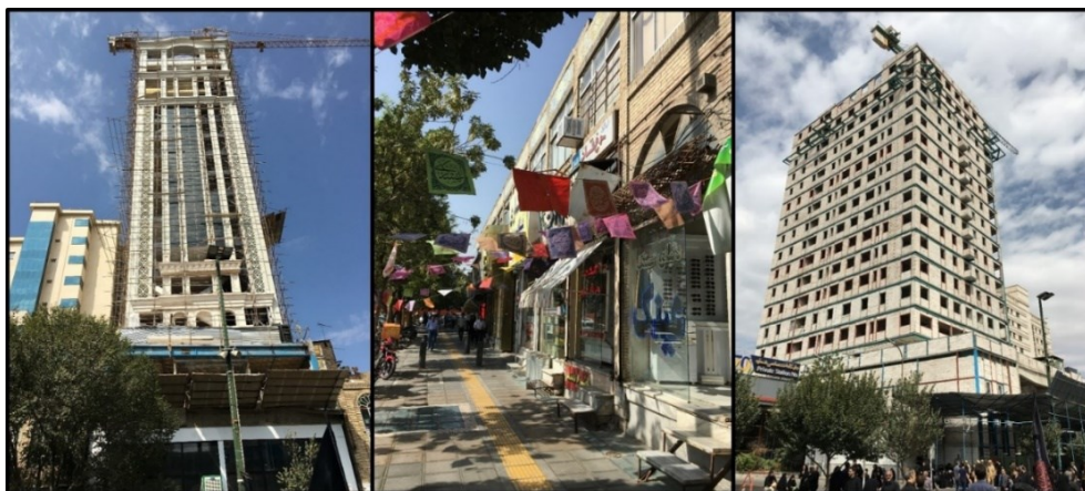
شکل (۳). جداره قدیمی و جداره جدید خیابان امام رضا (ع)

پس نباید هویت یک شهر و یا کشور را برای کسب ارزش افزوده و سود عده‌ای قلیل برای سال‌های متمادی، نامتقارن و ناهماهنگ با حرم مطهر و فرهنگ ایرانی نمود. خیابان امام رضا(ع) در اتصال با حرم مطهر است و تنها سه خیابان دیگر (شیرازی، طبرسی و نواب صفوی) با این نقش وجود دارند. البته عرض خیابان امام رضا(ع) در وضعیت کنونی از سه خیابان مذکور بیشتر است. با مقایسه گذشته و امروز خیابان امام رضا(ع) تفاوت جداره‌ها به وضوح مشخص می‌شود. امروز به جای آنکه مردم شاهد توجه مدیران شهری به چنین نمونه‌هایی و حفاظت و حراست از آن‌ها و نیز تکرار آن سیاست‌ها در دیگر نقاط شهر باشند، شاهد از بین رفتن این آثار و به وجود آمدن ساختمان‌های مرتفع در نزدیکی حرم مطهر هستند. بدون هیچ‌گونه ضابطه و قانونی و بدون توجه به جداره‌های طراحی شده چهار دهه پیش، هر طور که مالکان و صاحبان املاک مایل باشند، می‌توانند ساخت و ساز و یا مرمت کنند. در شکل (۳) جداره چهار دهه پیش با خط آسمان هماهنگ ملاحظه می‌گردد. اما امروز هتل‌هایی با ارتفاع، ابعاد، اندازه و نمای متفاوت شکل گرفته‌اند و یا در حال شکل‌گیری هستند.