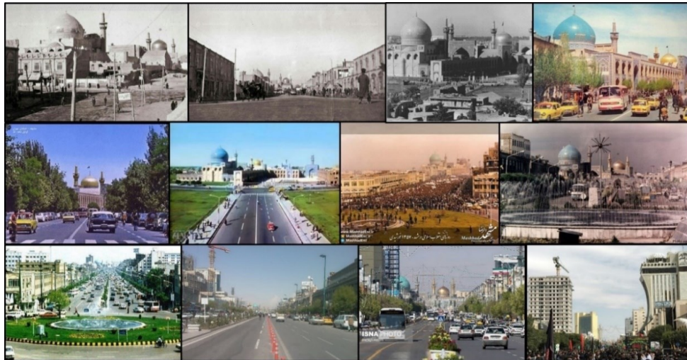
شکل (۲). منظر خیابان امام رضا (ع) در قرن اخیر

تعهد در بین مدیران، مسئولان، برنامه‌ریزان و طراحان شهری موجب این ناهماهنگی و بی‌نظمی در خیابان امام رضا (ع) شده است. در شکل (۲) منظر خیابان امام رضا (ع) در قرن اخیر آورده شده است.