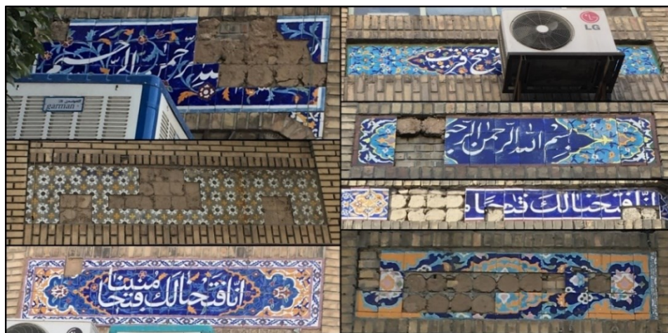
شکل (۶). نمونه‌هایی از بی‌توجهی و مرمت ن نمودن جداره خیابان امام رضا (ع)

است، هم از سوی مالکان و هم از سوی مدیریت شهری. جداره طراحی شده هویت‌مند، بومی و پایدار در سال ۱۳۵۵ اجرا شده است که امروز به واسطه دلایل مختلف رو به فراموشی است.