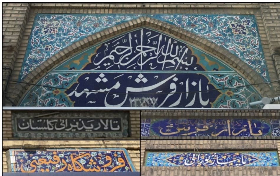
شکل (۵). نمونه‌هایی از تابلوهای استفاده شده در جداره خیابان امام رضا(ع)

جداره‌های خیابان امام رضا(ع) دو دسته نوشته بر روی خود دارند. یکی ذکرهایی است که با کاشی‌کاری بر روی جداره خیابان نقش بسته‌اند و دیگری نام بازارها، پاساژها و واحدهای تجاری است. همه این‌ها با ظاهری هماهنگ و هم‌خوان با یکدیگر شکل گرفته‌اند که هم فرهنگ ایرانی و هم آموزه‌های اسلامی را به نحو مطلوبی به نمایش می‌گذارند. در شکل (۵) نمونه‌ای از کاشی‌کاری‌های از این دست ملاحظه می‌گردد.