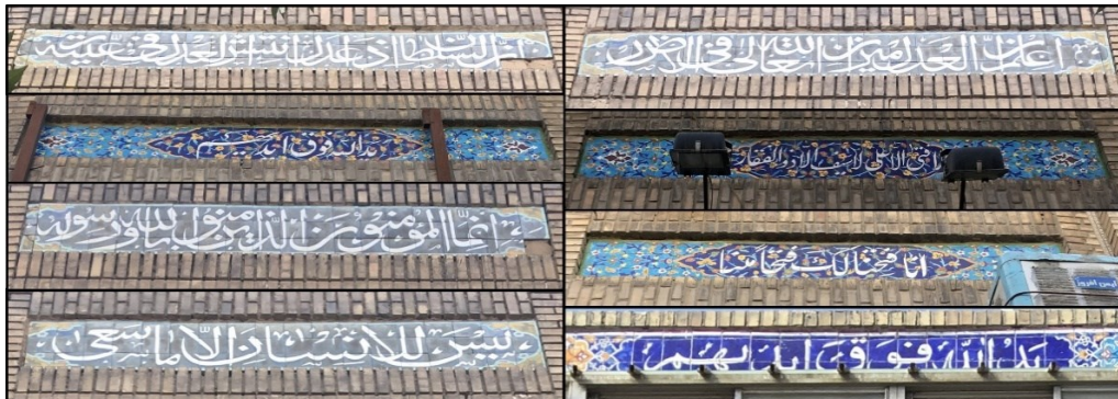
شکل (۴). نمونه‌هایی از اذکار استفاده شده در جداره خیابان امام رضا (ع)

جداره‌های خیابان امام رضا(ع) دو دسته نوشته بر روی خود دارند. یکی ذکرهایی است که با کاشی‌کاری بر روی جداره خیابان نقش بسته‌اند و دیگری نام بازارها، پاساژها و واحدهای تجاری است. همه این‌ها با ظاهری هماهنگ و هم‌خوان با یکدیگر شکل گرفته‌اند که هم فرهنگ ایرانی و هم آموزه‌های اسلامی را به نحو مطلوبی به نمایش می‌گذارند. در شکل (۵) نمونه‌ای از کاشی‌کاری‌های از این دست ملاحظه می‌گردد.