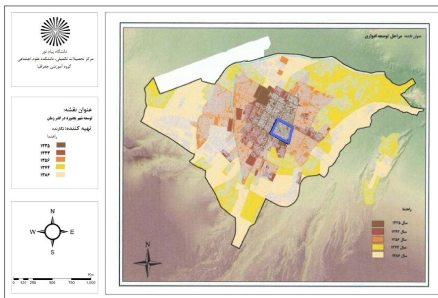
شکل (۳). توسعه فیزیکی شهر بجنورد ۱۳۲۵-۱۳۸۶