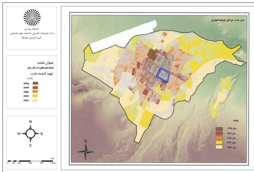
شکل (۳). توسعه فیزیکی شهر بجنورد ۱۳۳۵-۱۳۸۶